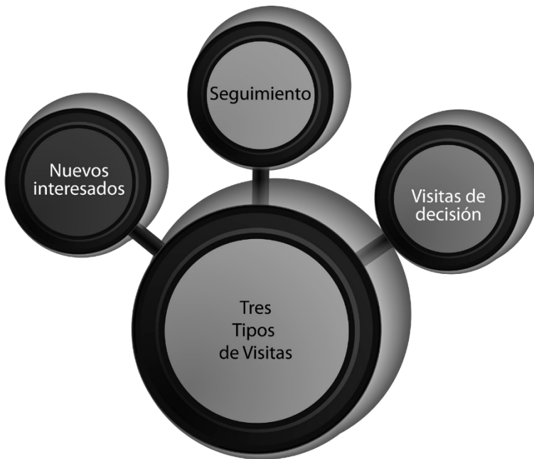
Figura 1: Tipos de visitas de evangelización